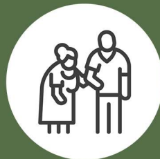
SERVICIOS SOCIOCULTURALES Y A LA COMUNIDAD