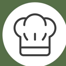
HOSTELERÍA Y TURISMO