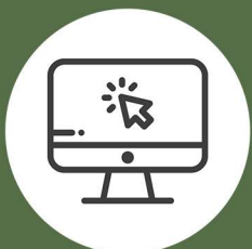
INFORMÁTICA Y COMUNICACIÓN