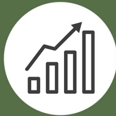
COMERCIO Y MARKETING