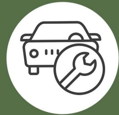
TRANSPORTE Y MANTENIMIENTO DE VEHÍCULOS