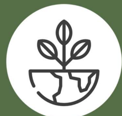
SEGURIDAD Y MEDIO AMBIENTE